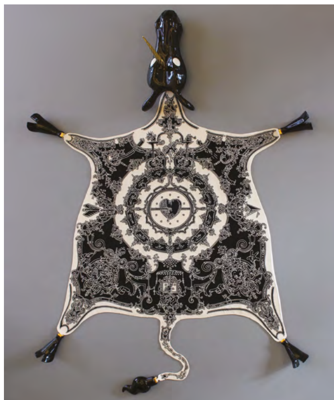
Peau de licorne , Nicolas Buffe, Grand prix 2010 de la Cité internationale de la tapisserie.

En 10 ans, les appels à projet de la Cité internationale de la tapisserie ont attiré près de 1 300 artistes contemporains, designers, architectes, créateurs de mode, issus de 45 pays. Cette diversité de participants et d'approches reflète les multiples dimensions de la tapisserie d'Aubusson :