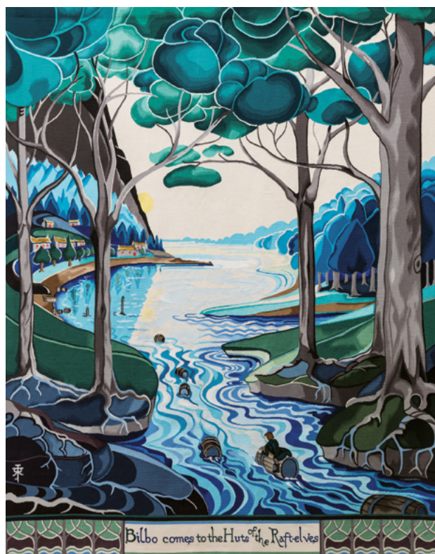
1 ère tapisserie tissée par l'Atelier A2, "Bilbo comes to the Huts of the Raft-Elves"

Le suivi de ce grand projet offre aux enseignants des perspectives de travail en histoire, anglais, français, arts plastiques, modelage, musique, etc. Aussi nous vous invitons à entrer en contact avec nous pour préciser des idées et établir des projets en collaboration avec la Cité. Divers établissements scolaires et enseignants sont dorés et déjà engagés dans des thématiques rattachées à l'œuvre de Tolkien.